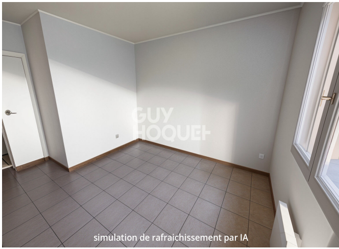
simulation de rafraichissement par IA