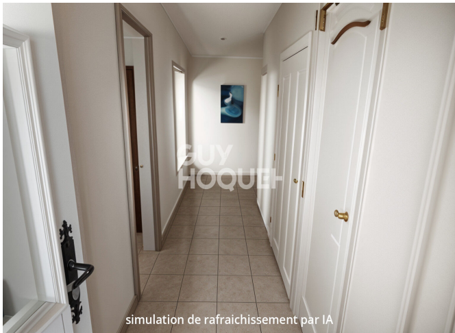
simulation de rafraichissement par IA